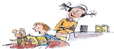
9. Le droit de lire à voix haute