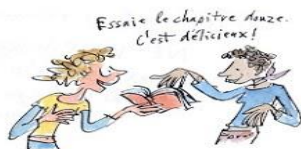
8. Le droit de grappiller