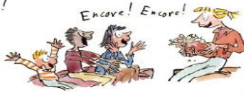
4. Le droit de relire