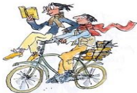
7. Le droit de lire n'importe où