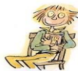
10. Le droit de nous taire

Ces 10 droits se résument en 1 seul devoir: NE VOUS MOQUEZ JAMAIS de ceux qui ne lisent pas, si vous voulez qu'ils lisent un jour.