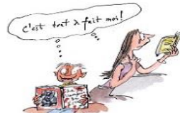
6. Le droit au bovarisme