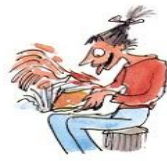
2. Le droit de sauter des pages