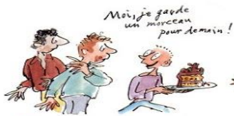
3. Le droit de ne pas finir un livre