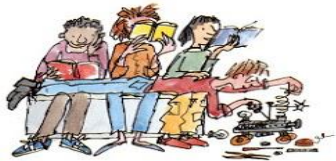
1. Le droit de ne pas lire

par Daniel Pennac illustrations de Quentin Blake