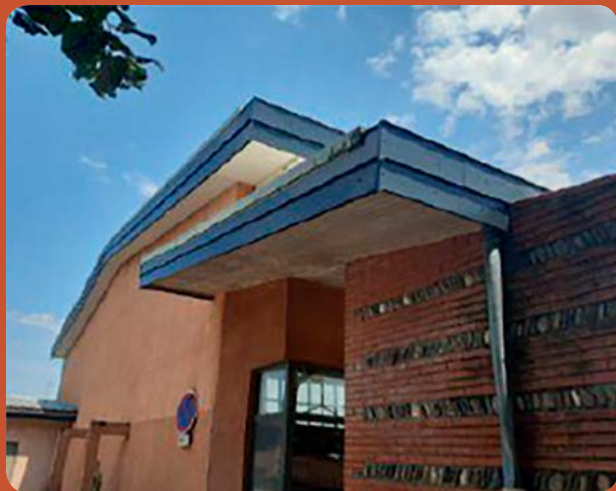
Travaux de reprise de la toiture de la Halle aux Sports (31 582 € TTC)