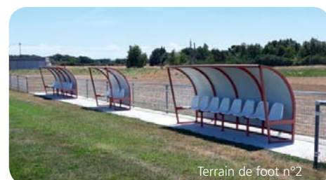
Terrain de foot n°2