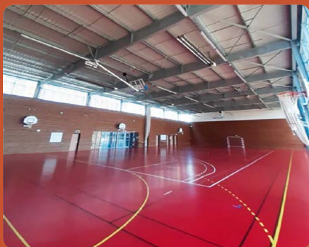
Relamping en LED du Gymnase Germaine Tillion (44 351 € TTC)