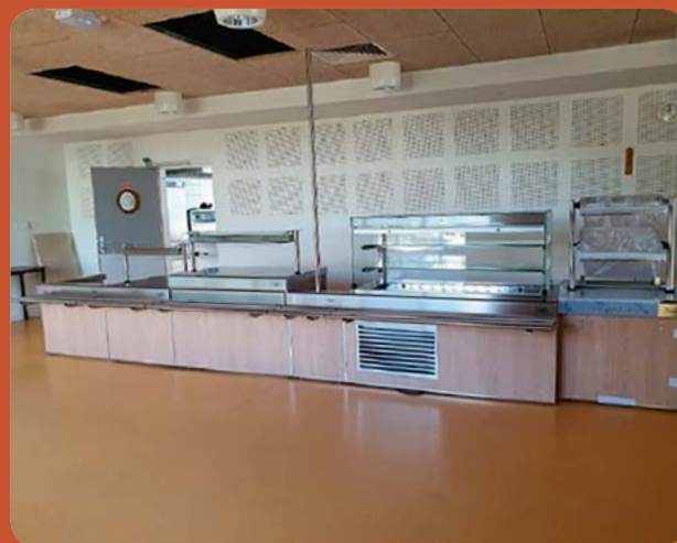
Transformation de la salle de restauration de l'école Jules Ferry en self (89 523 € TTC)