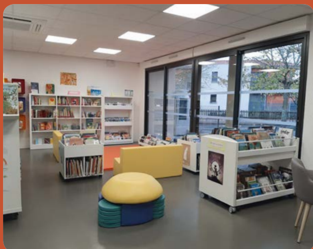
Réutilisation de l'ancienne école en crèche et médiathèque et PIJ (965 628 € TTC)