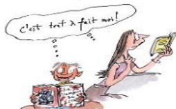
6. Le droit au bovarisme