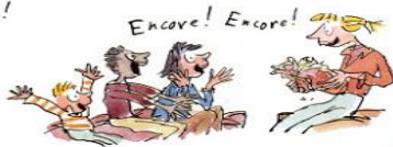
4. Le droit de relire