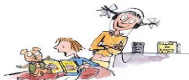
9. Le droit de lire à voix haute