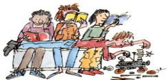
1. Le droit de ne pas lire

par Daniel Pennac illustrations de Quentin Blake