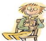
10. Le droit de nous taire

Ces 10 droits se résument en 1 seul devoir