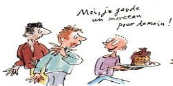
3. Le droit de ne pas finir un livre