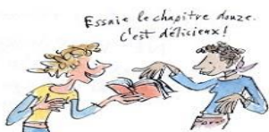
8. Le droit de grappiller