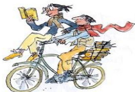
7. Le droit de lire n'importe où