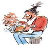
2. Le droit de sauter des pages